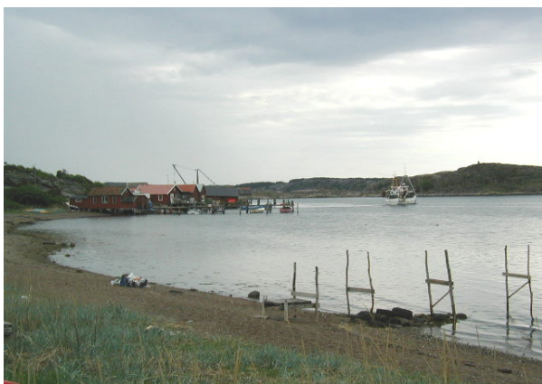
En viktig del av områdets grönstruktur är tillgängligheten till stränderna.

Terrängen öster och nordost om Grebbestad används för både idrott och rörligt friluftsliv. Här finns vandringsleder och motionsslinga i anslutning till idrottsplatsen Siljevi. Området erbjuder flera utflyktsmål som Greby gravfält och Falkeröds hembygdsgård.