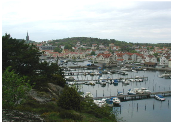
Bergen inne i samhället har stor betydelse för Grebbestads identitet.