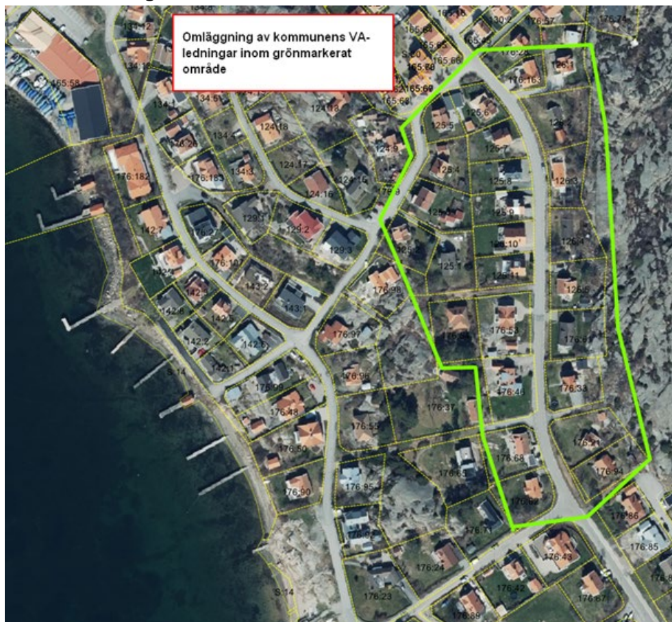
Figur 2 Område som ingår i planen för omläggning av vatten och avlopp samt dagvatten