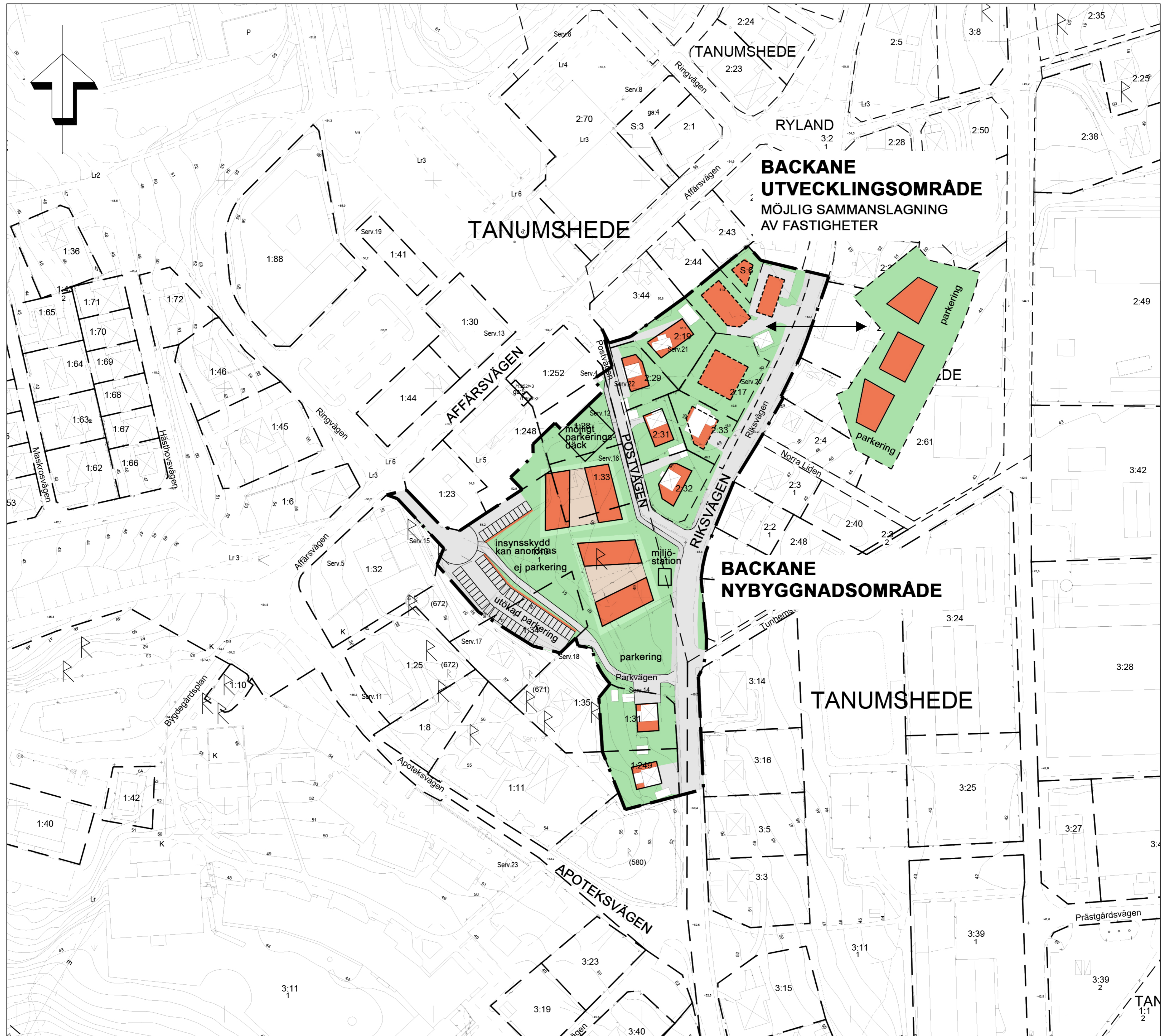
PLANILLUSTRATION, SKALA 1:1000 I A1