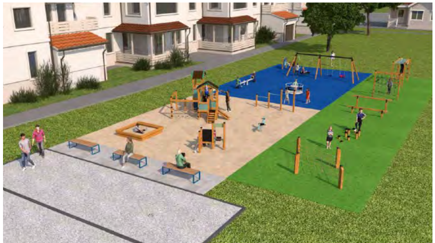
Illustration av lekplatsens olika ytor.

Färgerna på lekredskapen är nedtonade och naturnära. Med tanke