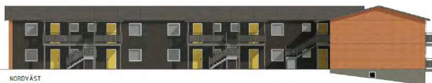
Skiss som visar hur husen på Granvägen kommer se ut efter renoveringen.