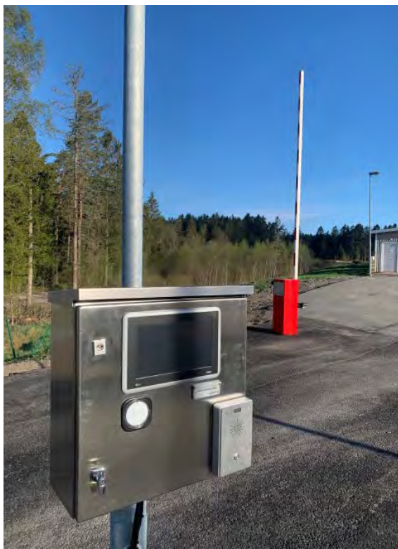
Bom och kortläsarterminal på Hästesked Återvinningscentral i Munkedals kommun.

Under våren 2022 har Rambo AB påbörjat införandet av passersystem i kommunerna Munkedal, Lysekil, Sotenäs och Tanum. Först ut är Hästesked i Munkedals kommun och Skaftö i Lysekils kommun, där pilotanläggningar driftsätts under våren 2022. Anledningarna till införandet av passersystemet är många. Men framför allt skapar det en säkrare vistelsemiljö för medarbetare och besökare, ger en mer rättvis betalning samt minskar antalet transporter.