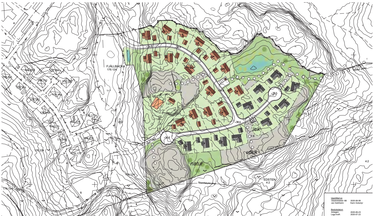
Flig – del av illustrationskarta till detaljplan för del av Flig 1:6 med flera, Fjällbacka.

Just nu pågår inom tekniska förvaltningen ett arbete med det nya exploateringsområdet Flig, Fjällbacka. Projektet syftar till att bygga ut nödvändig infrastruktur (väg, VA, etc.) för att senare kunna möjliggöra försäljning och utbyggnad av 25 bostadstomter i området. Till grund för arbetet ligger Detaljplan för del av Flig 1:6 med flera, Fjällbacka.