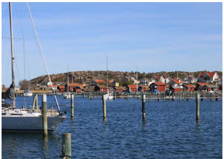
Vy över Långsjö.

Enskilda avlopp ersätts med en kommunal anslutning och avloppet pumpas till Bodalens avloppsreningsverk utanför Grebbestad. Planering har pågått under en längre tid, och arbetet i fält kommer att starta efter sommaren 2022 i båda områdena. I Långsjö är det över 100 fastigheter som ska anslutas och i Ulmekärr är det cirka 45 fastigheter.