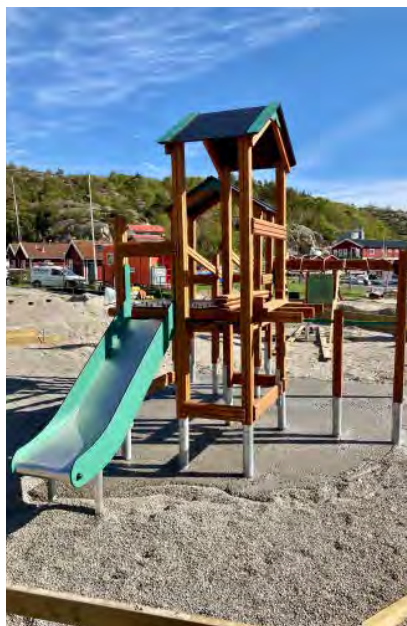
Klätterställning för klättersugna barn.