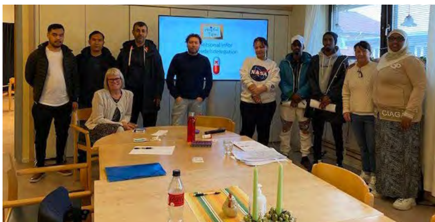
Att hantera läkemedel inom äldre- och funktionshinder är ett stort ansvar. Det är mycket viktigt att alla anställda förstår regler och rutiner. På bilden ser ni deltagare i vår studiecirkel om läkemedelshantering.

Att arbeta inom vård och omsorg kan innebära flera utmaningar. Det är mycket som personalen måste kunna för att ge en trygg och säker omvårdnad. Språkutvecklare, tillsammans med språkbuden inom omsorgen, gör därför flera olika insatser för att det svåra ska bli enklare och tydligare. Hur talar vi till varandra? Hur formulerar vi oss vid information och introduktionsmaterial? Hur gör vi interna utbildningar lättare för alla, att förstå och ta till sig?