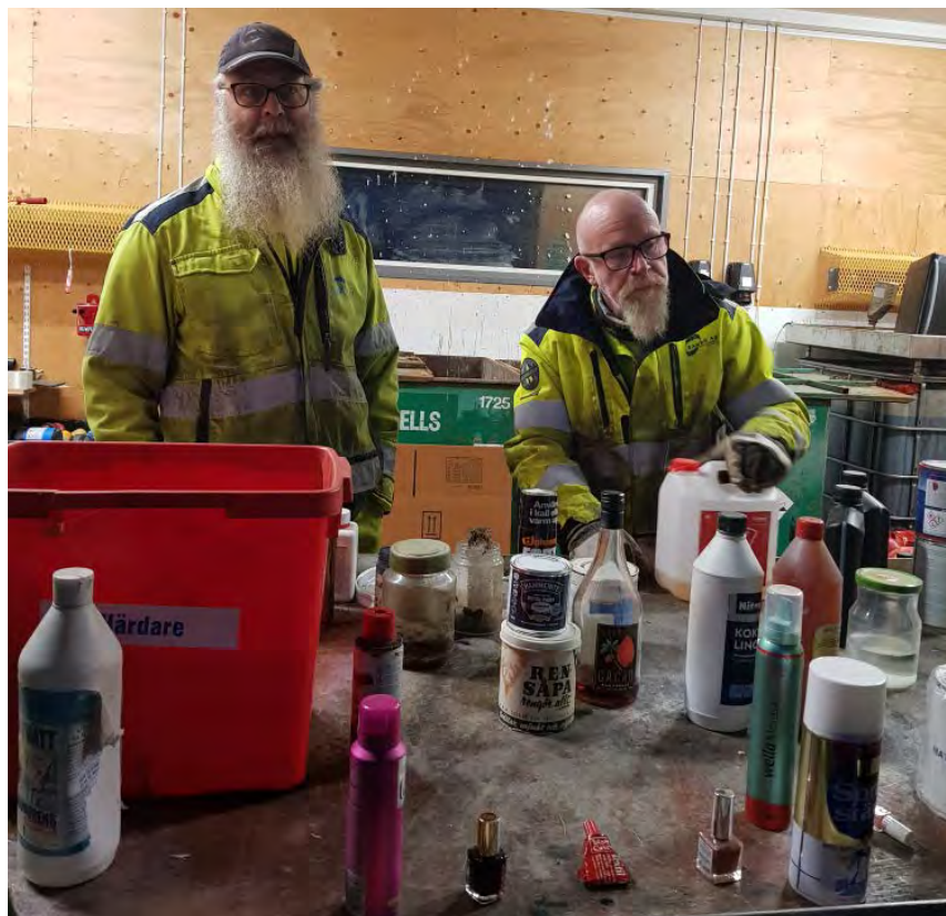
Medarbetare på Tyft visar deltagarna vilka typer av farligt avfall som kan komma in en vanlig dag på återvinningscentralen.

I det förra numret av informationstidningen Tanum kunde du läsa om hushållen i Tanum som deltar i tävlingen Minimeringsmästarna. Under våren har hushållen hunnit med tre tematräffar som handlade om matsvinn, farligt avfall och delande.