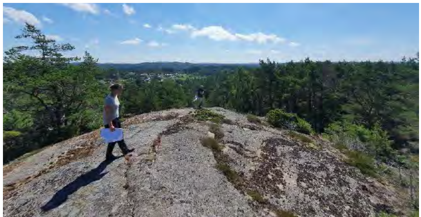
Kommunen VA- och vägprojektör inspekterar utsikten söder ut från området.

mynta ut i en upphandling av en entreprenör som blir ansvarig för genomförandet. I projekteringsfasen företas även en del kompletterande utredningar och undersökningar. Bland annat kommer en geoteknisk undersökning och en slutundersökning av en fornlämning, att företas under våren.