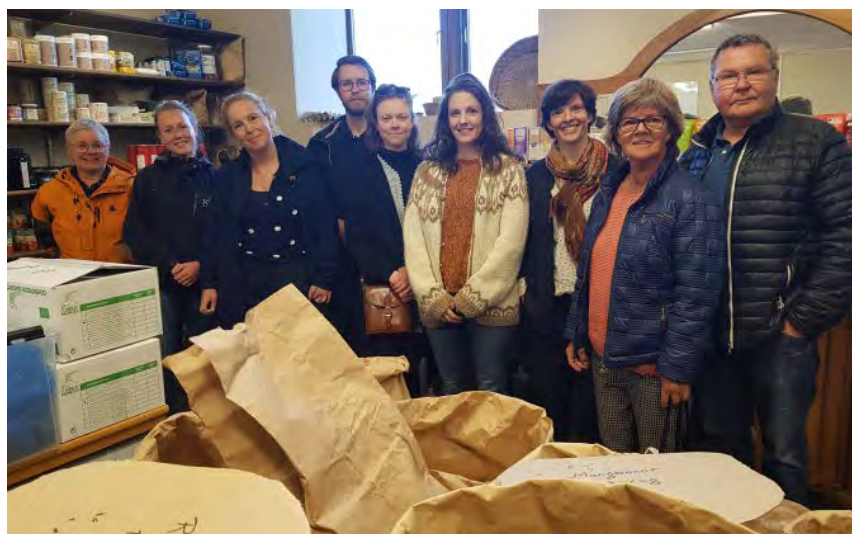
Tanums och Sotenäs minimeringsmästare i butiken hos Bottnafjordens inköpsförening.

Deltagarna fick en grundlig genomgång om farligt avfall: vad det är, hur det uppkommer och hur vi kan minska på det.