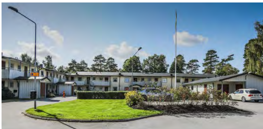
Nuvarande utseende på husen på Granvägen i Tanumshede.

Tanums Bostäders bostadshus på "gamla" Granvägen i Tanumshede byter utseende. Bostadsområdet, som färdigställdes 1977, har genom årens lopp endast genomgått mindre renoveringar. Under hösten planerar Tanums Bostäder för en yttre renoveringsinsats och entreprenör är K J Bygg AB. Den planerade renoveringen omfattar bland annat byte av tak, fasad, fönster, dörrar, trapphus, balkonger samt dränering. Även utemiljön kommer att få sig en ansiktslyftning. Den planerade renoveringsinsatsen beräknas vara klar under våren 2023. Under åren 2021–2022 har samtliga lägenheter totalrenoverats interiört.