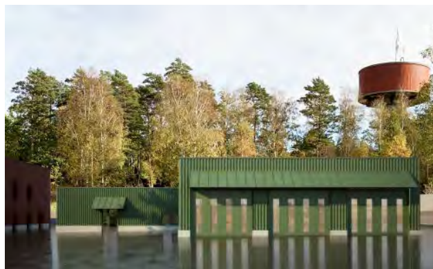
Strategiskt, toppmodernt och funktionellt. Till vänster fotomontage av den nya räddningsstationen och till höger den nya ambulansstationen.