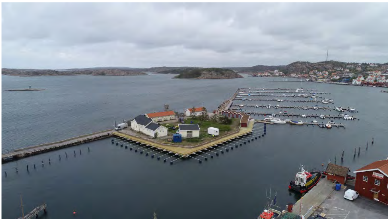
Badholmen i Fjällbacka efter renoveringen.