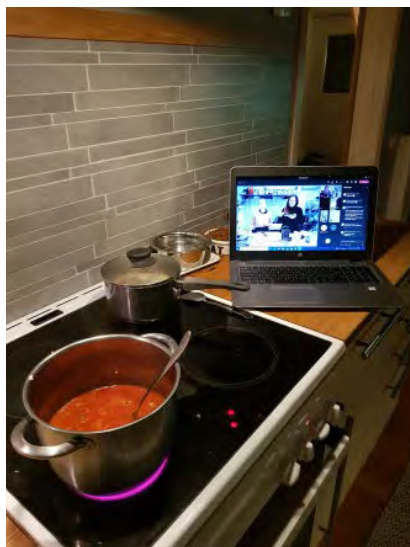
Matlagning pågår! Cook-along med lins-stroganoff på menyn.