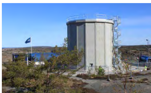
Det nya vattentornet på Källvikshöjden.