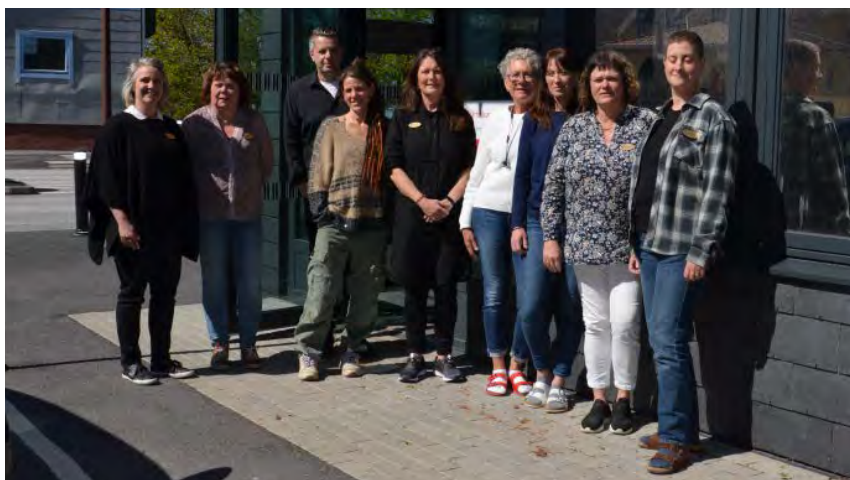
Några medarbetare utanför entrén till Möteshusets nya lokaler på Affärsvägen i Tanumshede.

På Möteshuset kan stora problem krympa till något som går att hantera och det går att få hjälp att reda ut sina små bekymmer innan de växer. Under våren flyttade verksamheten in i de nya lokalerna på Affärsvägen 4, mitt i Tanumshede.