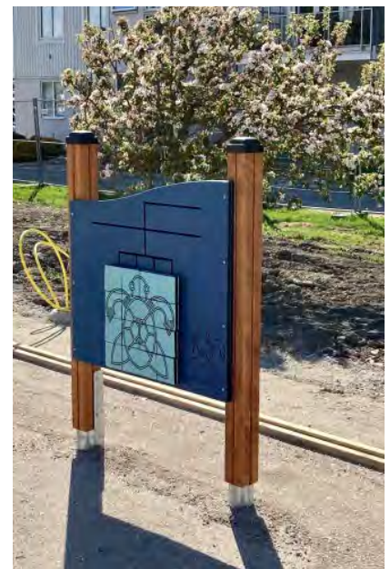
Vem kan lägga pusslet på pusselskärmen?

på det väderutsatta läget är många av lekställningarna gjorda av lärkträ, som är ett tåligt och i princip underhållsfritt material. De delar som är av lackat stål har genomgått en extra rostskyddsbehandling från fabrik.