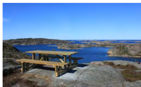
Ett av de nya borden på Källvikshöjden, där man kan njuta av utsikten.

På Källvikshöjden i Fjällbacka har kommunen uppfört ett nytt vattentorn. Det rymmer nästan tre gånger så mycket vatten som det gamla vattentornet på Vetteberget. Placeringen på Källvikshöjden är strate-