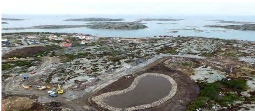
Tomtområdet på Kuseröd i Grebbestad.

Tanums Bostäder har beslutat att gå med i Allmännyttans Klimatinitiativ, ett gemensamt uppdrag för att minska utsläppen av växthusgaser. Målet i initiativet är att de allmännyttiga bostadsföretagen ska vara fossilfria senast år 2030 och att energianvändningen minskar med 30 procent till